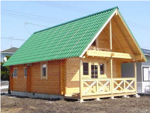
↑テラス屋根付「-R」タイプ